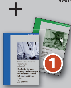
Ein Haus & Grund-Ratgeber nach Wahl

Jeder Werber von Mitgliedern im Bereich des Landesverbandes Haus & Grund Schleswig-Holstein erhält einen attraktiven famila-Einkaufsgutschein im Wert von 20,- €.